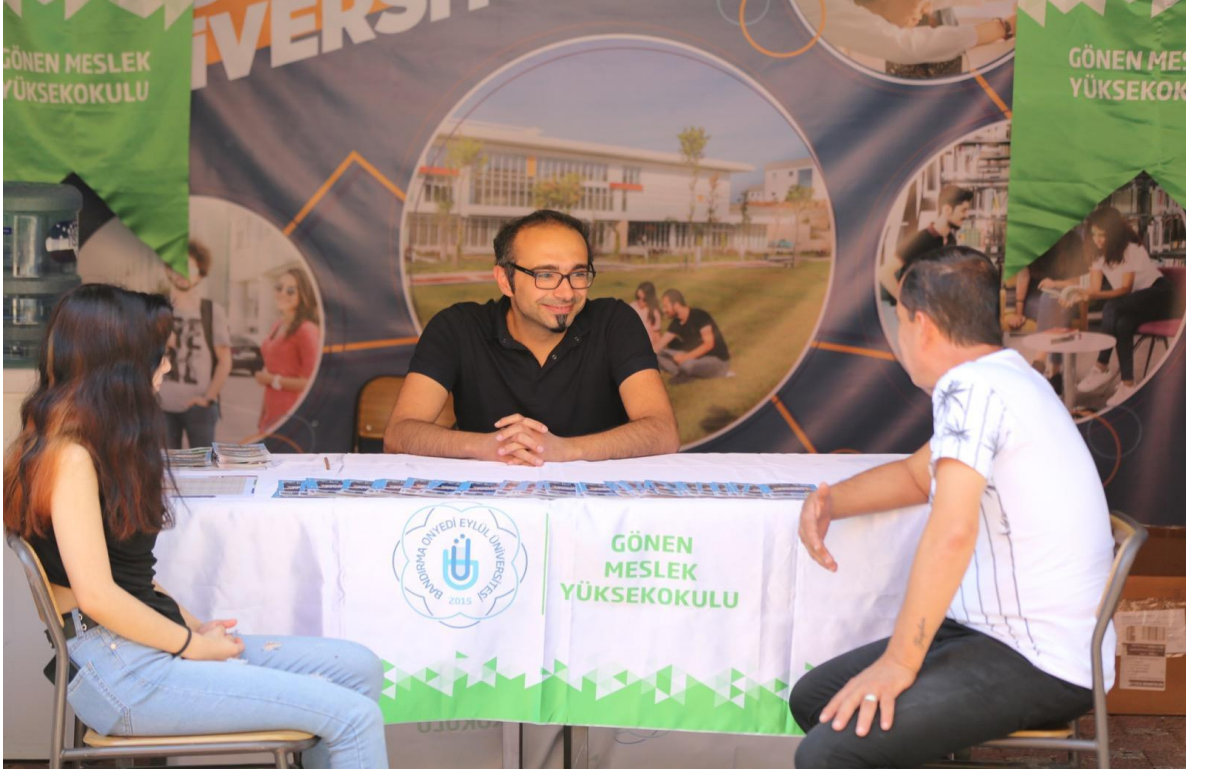
8 Ağustos 2022 Gonen MYO Tercih ve Tanıtım Fuarı