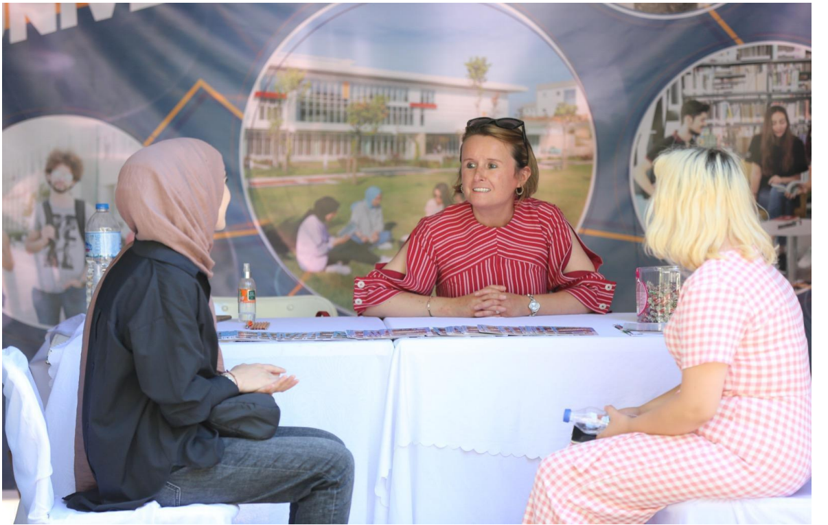
8 Ağustos 2022 Bandırma Tercih ve Tanıtım Fuarı