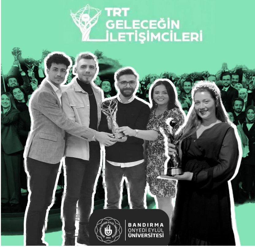
25 Ekim 2022 TRT Geleceğin İletişimcileri Yarışması