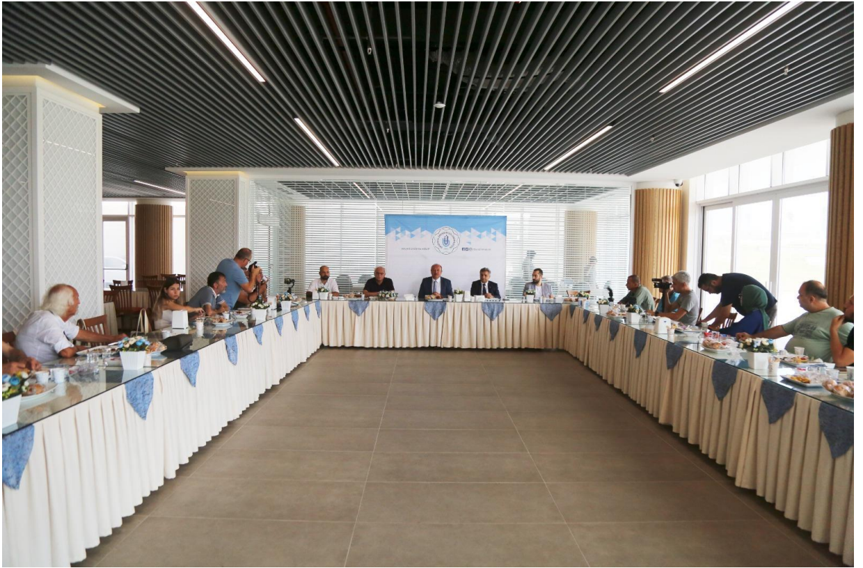
24 Ağustos 2022 Tarihli Basın Toplantısı

Rektörümüzün Üniversitemiz ile ilgili kamuoyunu bilgilendireceği, görüşlerini ifade edeceği basın toplantıları, Koordinatörlüğümüz tarafından organize edilmektedir. Ayrıca basın kuruluşları ve mensuplarının toplantıya davet edilmesi, toplantı öncesi ve süresince ağırlanması, toplantı gündemi ile ilgili gerekli bilgi ve görsellerle desteklenmesi işlemleri de Koordinatörlüğümüz tarafından gerçekleştirilmektedir. Bu kapsamda 2022 yılı içerisinde 2 basın toplantısı ve 9 basın ziyareti gerçekleştirilmiştir.