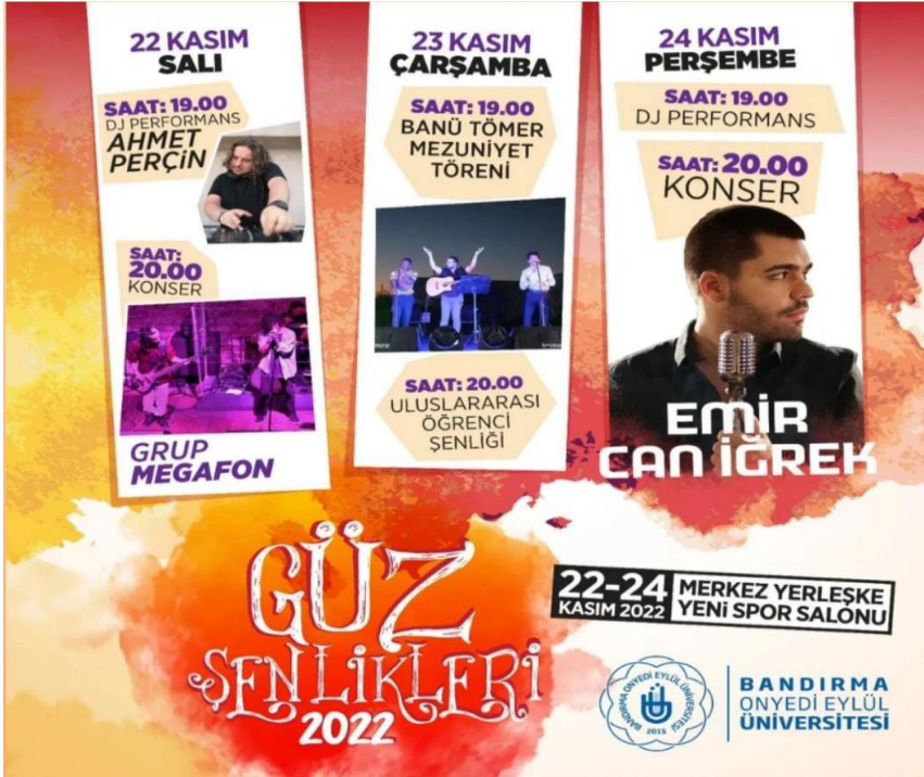
21 Kasım 2022 Güz Şenlikleri

Üniversitemize ait olan tanıtım materyalleri gelen istekler doğrultusunda ülkemizin dört bir yanındaki okul ve eğitim kurumlarına ücretsiz olarak posta ile gönderilmektedir.