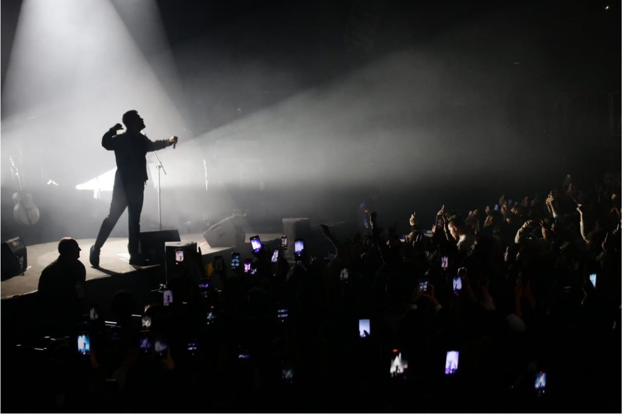
22 Kasım 2022 güz şenlikleri

Organizasyonun basın ayağını da yürüten Kurumsal İletişim Koordinatörlüğümüz, organizasyon öncesi basın daveti yazımı ve gönderimi, etkinlik sonrası organizasyon haberlerinin basına görsel malzemeleriyle birlikte ulaştırılması ve basında yer alması bağlamında da çalışmalarını sürdürmektedir.