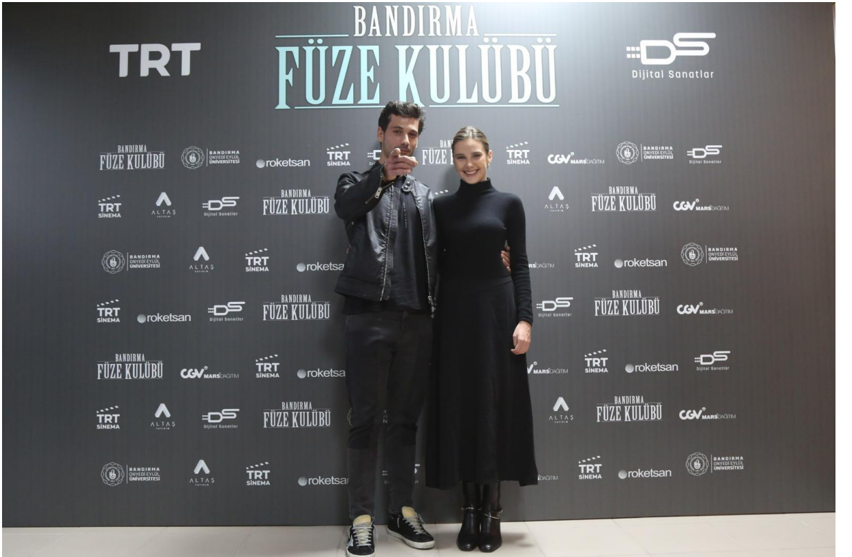
9 Kasım 2022 Bandırma Füze Kulübü Film Galası