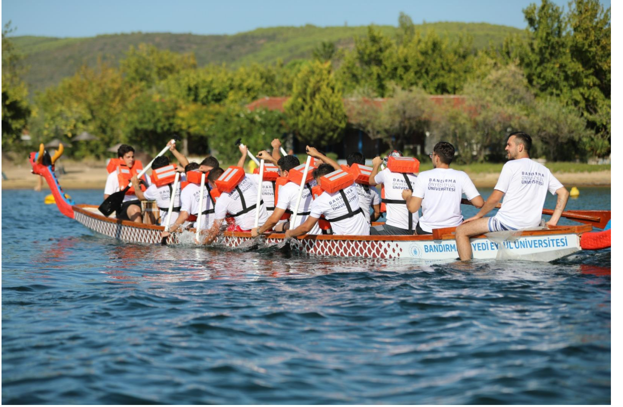
30 Eylül 2022 Dragon Bot Etkinliği