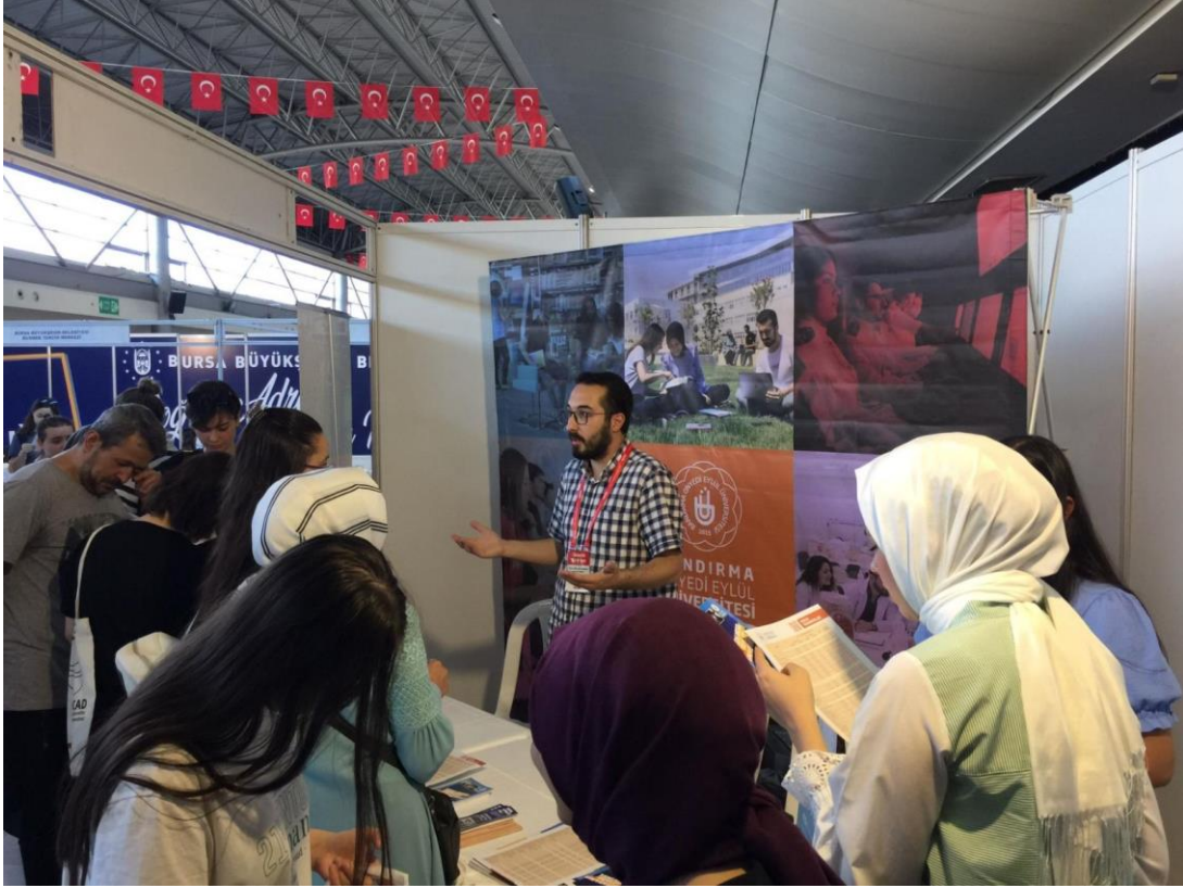
10 Ağustos 2022 Ankara Tercih ve Tanıtım Fuarı

Tanıtım faaliyetlerimizin diğer ayağını ise Üniversitemizin sosyal medya hesapları oluşturmuştur. Önceki dönemlere göre daha etkin bir şekilde kullanılan sosyal medya hesaplarımızdan aday öğrencilerin ve velilerin hem tercih döneminde hem de tercih dönemi sonrasında sorduğu sorulara en doğru ve hızlı şekilde cevap verilmiştir. Ayrıca Üniversitemize ait sosyal medya hesaplarında ve kurumsal web sayfasında haber, duyuru vb. bilgi girişleri güncel olarak sağlanmakta olup Üniversitemiz öğrencilerine, aday öğrencilere ve Üniversitemizin sosyal medya hesaplarını takip eden diğer kullanıcılara yönelik güncel sosyal medya içerikleri üretimi, önemli gün ve haftalarda Rektör Hocamızın mesajlarının paylaşılması da Koordinatörlüğümüzün iş kalemleri arasında yer almaktadır. Bu kapsamda 2022 yılı içerisinde 270 haber girişi, 270 haber metni yazımı, 221 duyuru, 2587 fotoğraf çekimi ve 76 görsel materyal tasarımı yapılmıştır. Bunlara ek olarak öğrencilerimizle ve genel takipçi kitlemizle ortak paydada buluşmak adına 30 “reels video” sosyal medya hesaplarımızdan paylaşılmıştır.