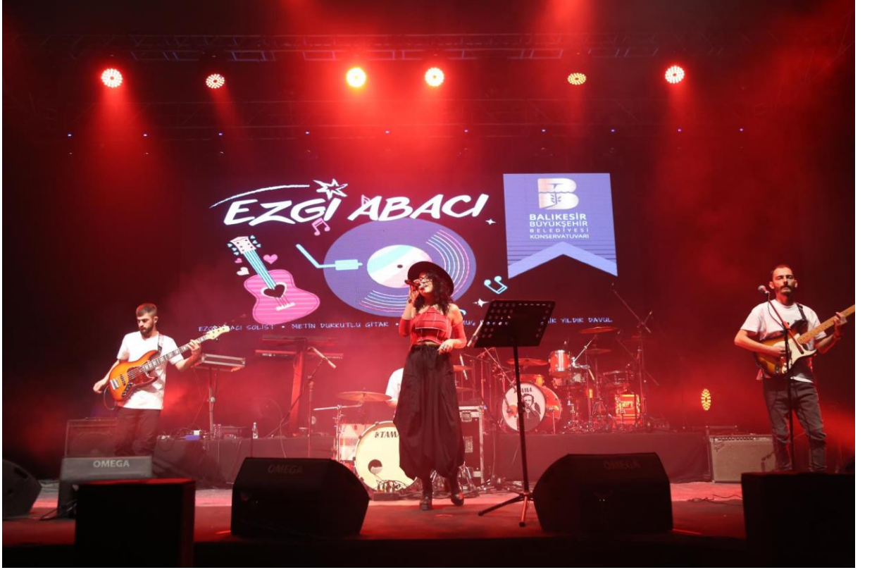
22 Kasım 2022 Güz Şenlikleri