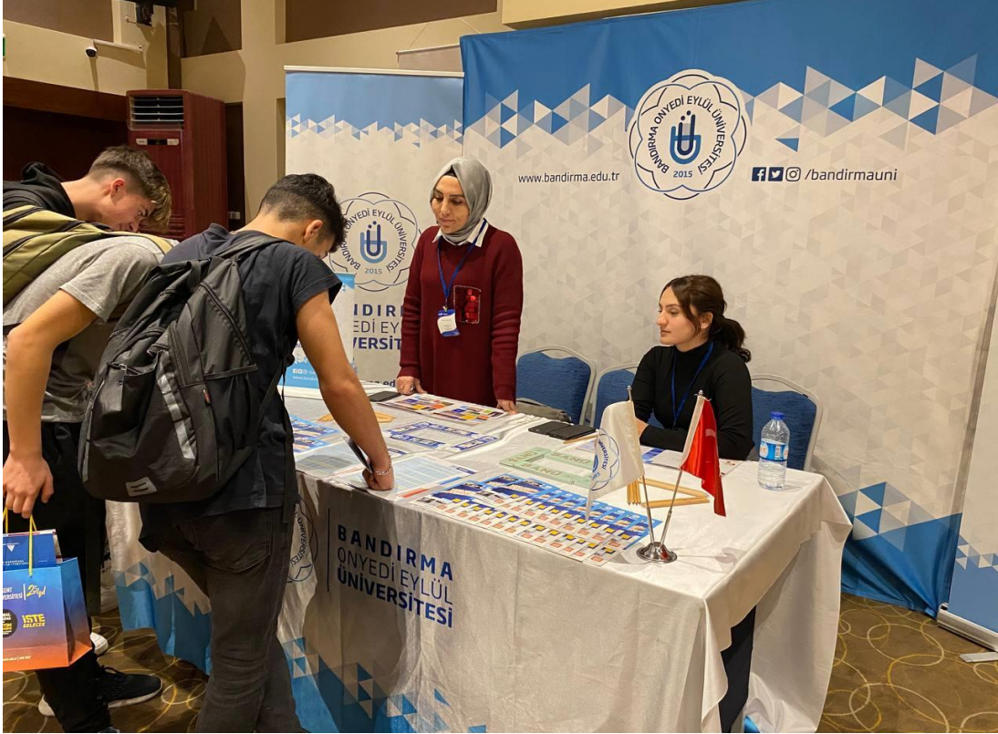
31 Aralık 2022 Çanakkale Fuarı

Ayrıca Ocak ayında İzmir ve Bursa, Şubat ayında Antalya, Mart ayında Çanakkale, İstanbul, Konya ve Kocaeli, Nisan ayında Tekirdağ, Mayıs ayında Balıkesir, Temmuz ayında İstanbul, Ankara, İzmir, Bursa ve Antalya, Aralık ayında ise Balıkesir, Çanakkale ve Bursa olmak üzere toplamda 18 (on sekiz) tanıtım ve tercih fuarına iştirak edilmiştir. Bunlara ek olarak Ağustos ayında "Tercih ve Tanıtım Günleri" düzenlemiştir. Düzenlenen ve iştirak edilen bu etkinliklerde aday öğrencilere, rehber öğretmenlere, okul yöneticilerine ve velilere Üniversitemiz akademik birimleri, bölümlere ait puanları, yerleşkeleri, burs ve konaklama imkanları ile Erasmus, Farabi ve Mevlana değişim programları hakkında bilgi paylaşımında bulunulmuştur.