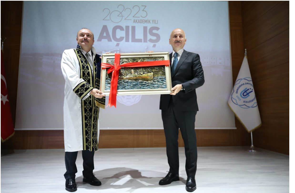
31 Ekim 2022 tarihli 2022-2023 Akademik Yılı Açılış Töreni