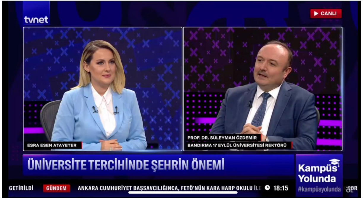
8 Ağustos 2022 Kampus Yolunda Programı

Koordinatörlüğümüz, Rektörümüz ile görüşmek ve röportaj yapmak isteyen medya mensuplarının taleplerini değerlendirerek Rektörümüzün zaman uygunluğu çerçevesinde kendilerine randevu verilmesi ve görüşmelerin gerçekleştirilmesini organize etmektedir. Röportaj ve görüşmelerin sağlıklı bir şekilde gerçekleştirilmesi ile medya mensuplarına görüşme öncesi veya sonrasında talep edilen bilgi ve materyallerin iletilmesi Koordinatörlüğümüzce sağlanmaktadır. Bu bağlamda 2022 yılı içerisinde Rektörümüz ile basın mensupları arasında 3 röportaj ve görüşme gerçekleştirilmiştir.