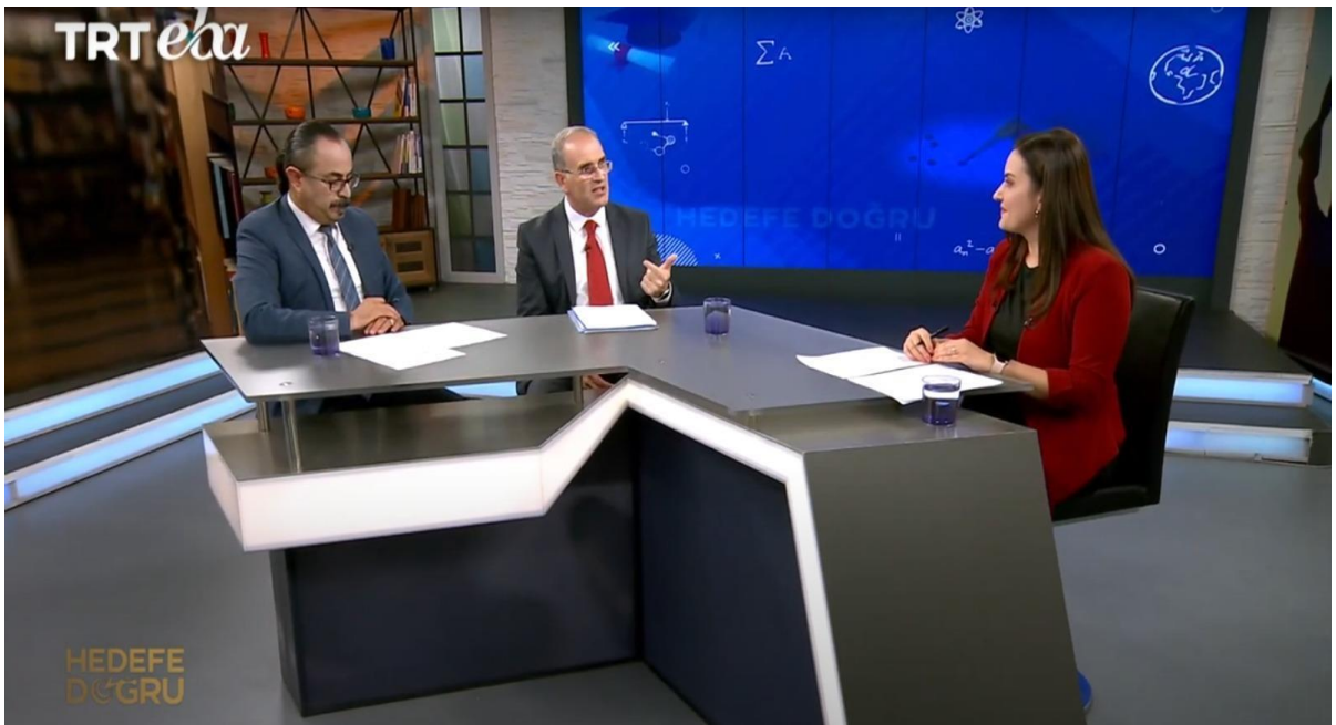
22 Temmuz 2024 TRT Eba “Hedefe Doğru” Programı

Koordinatörlüğümüz, Rektörümüz veya Rektör Yardımcılarımız ile görüşmek ve röportaj yapmak isteyen medya mensuplarının taleplerini değerlendirerek zaman uygunluğu çerçevesinde kendilerine randevu verilmesi ve görüşmelerin gerçekleştirilmesini organize etmektedir. Röportaj ve görüşmelerin sağlıklı bir şekilde gerçekleştirilmesi ile medya mensuplarına görüşme öncesi veya sonrasında talep edilen bilgi ve materyallerin iletilmesi Koordinatörlüğümüzce sağlanmaktadır. Bu bağlamda 2024 yılı içerisinde ulusal televizyon kanallarında 1 (bir) canlı yayın gerçekleştirilmiştir. Ayrıca Rektörümüz tarafından yerel basın mensuplarına yazılı ve görsel medyada yayınlanan mülakatlar verildi.