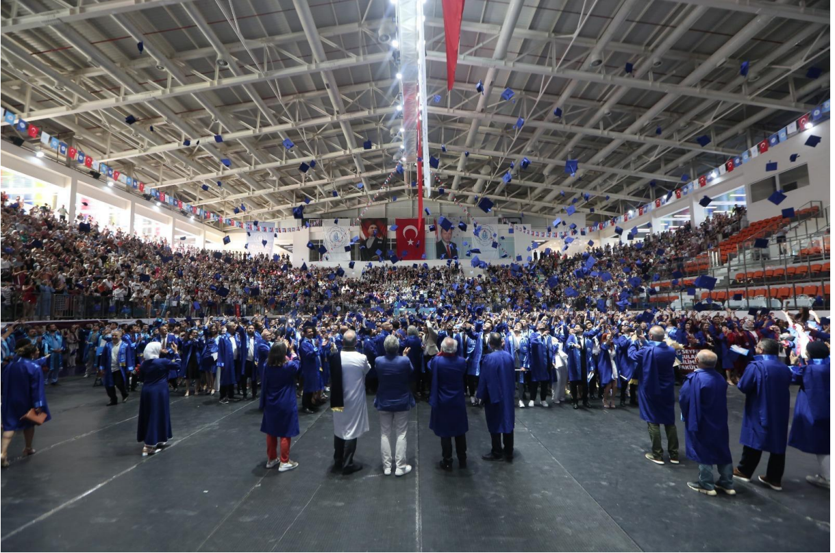
Temmuz 2024 Mezuniyet Töreni

Organizasyonun basın ayağını da yürüten Kurumsal İletişim Koordinatörlüğümüz, organizasyon öncesi basın daveti yazımı ve gönderimi, etkinlik sonrası organizasyon haberlerinin basına görsel malzemeleriyle birlikte ulaştırılması ve basında yer alması bağlamında da çalışmalarını sürdürmektedir.