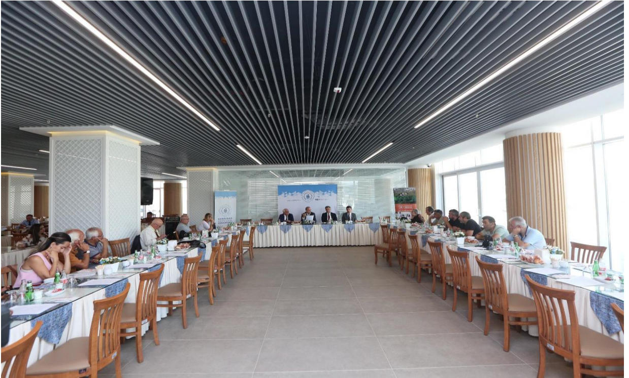
6 Eylül 2024 Tarihli Basın Toplantısı

Rektörümüzün Üniversitemiz ile ilgili kamuoyunu bilgilendireceği, görüşlerini ifade edeceği basın toplantıları, Koordinatörlüğümüz tarafından organize edilmektedir. Ayrıca basın kuruluşları ve mensuplarının toplantıya davet edilmesi, toplantı öncesi ve süresince ağırlanması, toplantı gündemi ile ilgili gerekli bilgi ve görsellerle desteklenmesi işlemleri de Koordinatörlüğümüz tarafından gerçekleştirilmektedir. Bu kapsamda 2024 yılı içerisinde 1 (bir) basın toplantısı gerçekleştirilmiştir.