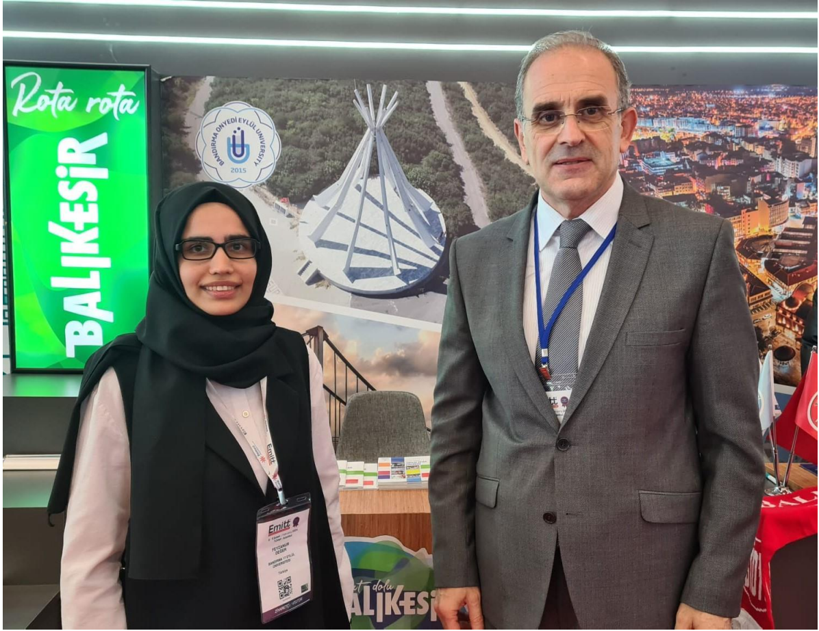
Şubat 2024 EMITT Fuarı

puanları, yerleşkeleri, burs ve konaklama imkanları ile Erasmus, Farabi ve Mevlâna deęişim programları hakkında bilgi paylaşımında bulunulmuştur.