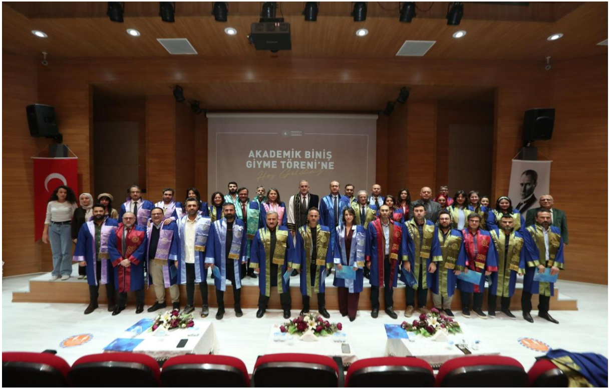
18 Aralık 2024 Akademik Biniş Giyme Töreni