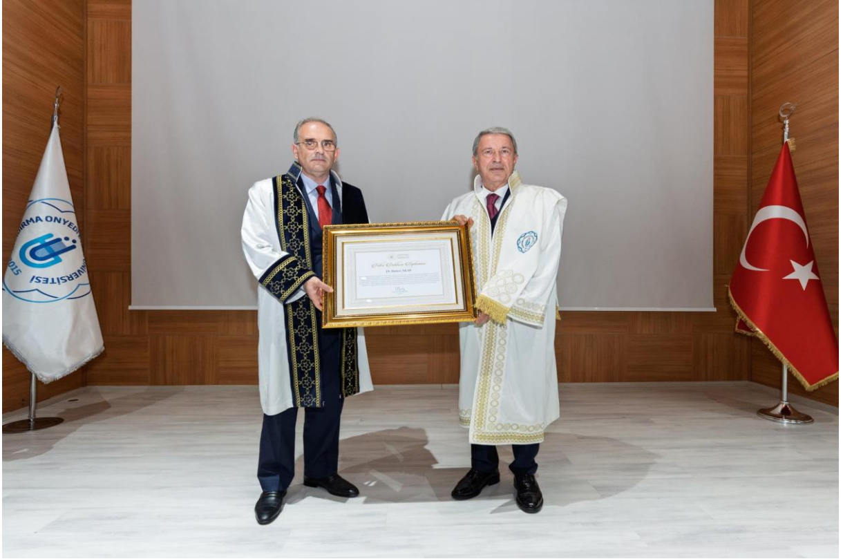
1 Kasım 2024 Fahri Doktora Töreni