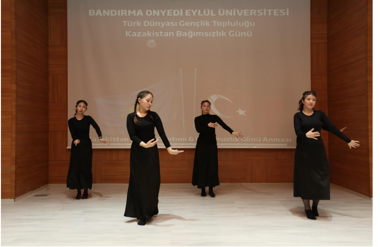
26 Aralık 2024 TÖMER Kazakistan Bağımsızlık Günü