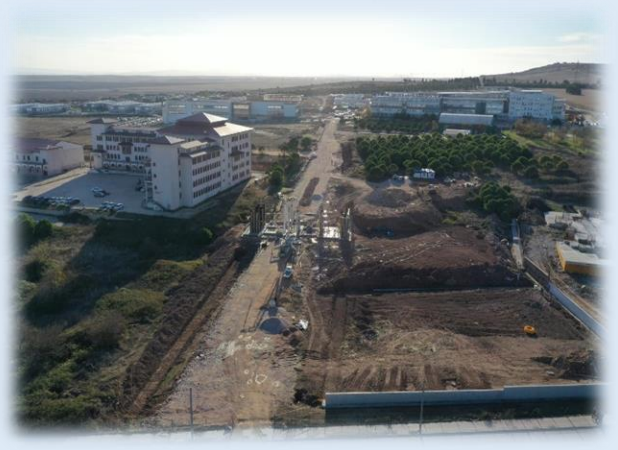
Resim: Merkez Yerleşke Ana Giriş Kapısı ve Çevre Düzenleme Yapılması İşi