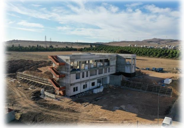
Resim: Merkezi Araştırma Laboratuvar Binası