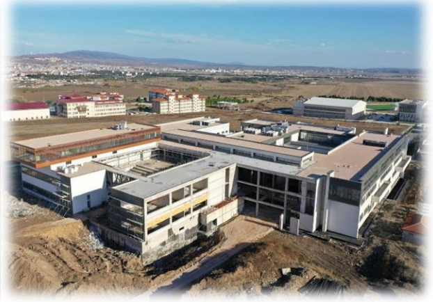
Resim: Merkezi Derslik Binası