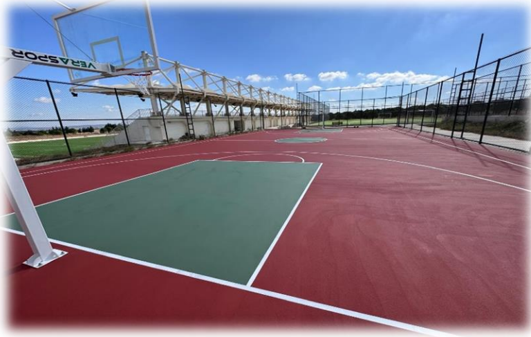
Resim: Açık Spor Tesisleri Görünüm

İhale Bedeli (KDV Dahil) : 2.698.546,80 TL 2024 Yılı Bütçesi : 2.700.000,00 TL 2024 Yılı Harcama Tutarı : 2.698.546,80 TL