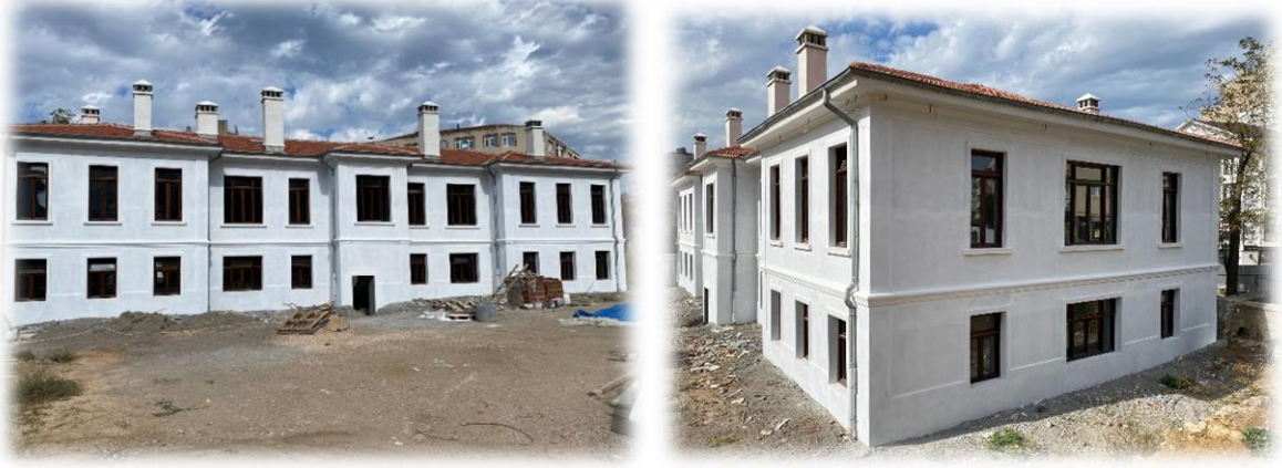
Resim: Pertevniyal Hastanesi Restorasyon Uygulama İşi