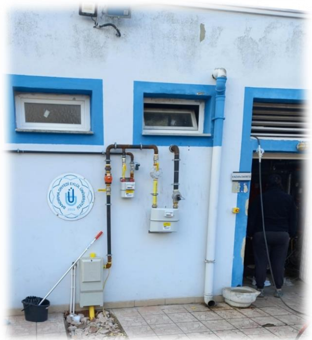
Resim: Erdek MYO Doğalgaz Hattı Çekilmesi ve Doğalgaz Dönüşüm İşi